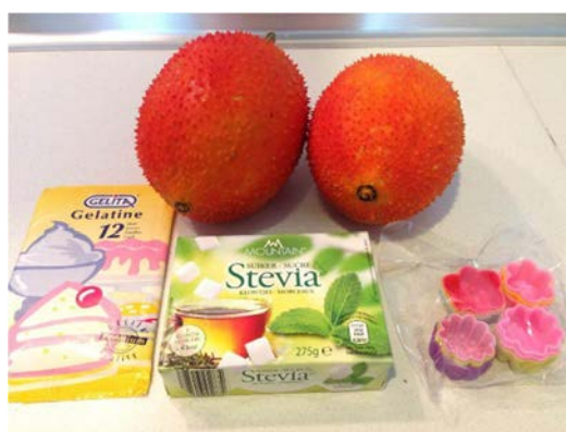
ภาพที่ 2 วัตถุดิบในการทำวุ้นฟักข้าว

*หมายเหตุ คำนวนปริมาณสตีเวียจากฉลากโภชนาการข้างกล่อง โดยสตีเวีย 1 ก้อน จะมีปริมาณ 1.4 กรัม ให้ปริมาณความหวานเท่ากับน้ำตาล 5 กรัม