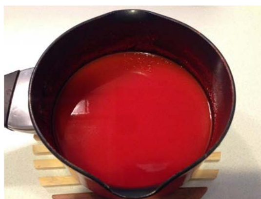
ภาพที่ 6 น้ำฟักข้าวที่ตั้งไฟจนเดือด

จากนั้นนำน้ำฟักข้าวที่กรองได้ผสมกับน้ำสะอาดจนมีปริมาตร 500 มิลลิลิตร นำน้ำฟักข้าวที่ผสมกับน้ำสะอาด ขึ้นตั้งไฟจนเดือดแล้วใส่สารให้ความหวานแทนน้ำตาล 10 ก่อน แล้วชิมรสชาติให้มีความหวานพอประมาณ จากนั้นใส่แผ่นเจลาตินที่อ่อนตัวลงไปลงในน้ำฟักข้าว แล้วรอให้เดือดอีกครั้ง ดังภาพที่ 3.4