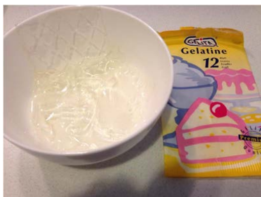
ภาพที่ 5 แผ่นเจลาตินที่แช่ในน้ำสะอาด

แช่แผ่นเจลาตินในน้ำสะอาด โดยแช่จนกว่าแผ่นเจลาตินนั้นจะเหลว ดังปรากฏในภาพที่ 3.3 โดยในการทำวุ้นฟักข้าว นั้นจะใช้แผ่นเจลาติน 3 แผ่นต่อน้ำฟักข้าว 500 มิลลิลิตร