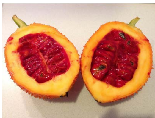
ภาพที่ 3 ผลฟักข้าวที่ผ่าตามแนวยาว

เลือกเอาเฉพาะผลฟักข้าวที่มีสีส้มแดงหรือผลฟักข้าวที่สุกเต็มที่ มาใช้ในหารทำวุ้นฟักข้าว เนื่องจากผลฟักข้าวที่สุกเต็มที่นั้น จะมีเนื้อที่ให้สีแดงสด และจะทำให้วุ้นฟักข้าวมีสีสวย การสังเกตว่าผลฟักข้าวนั้นสุก อาจสังเกตได้จากการกดผลฟักข้าวเบาๆ ถ้าผลฟักข้าวมีความนิ่ม นั่นก็แสดงว่าเป็นผลฟักข้าวที่สุก จากนั้นผ่าผลฟักข้าวตามแนวยาว เพื่อที่จะเอาเมล็ดออกมากตัวเนื้อฟักข้าวต่อไป