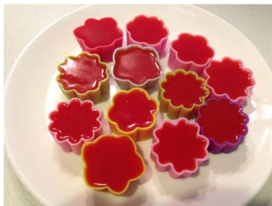
ภาพที่ 7 วุ้นพริกข้าว

ทั้งน้ำพริกข้าวที่ตั้งไฟจนเดือดไว้จนเย็น จากนั้นค่อยๆ เหน้าพริกข้าวลงในพิมพ์วุ้น ดังภาพที่ 3.5 จากนั้นนำเข้าสู่เย็น แล้วค่อยๆ แคะตัวเนื้อวุ้นพริกข้าวออกจากพิมพ์ต่อไป